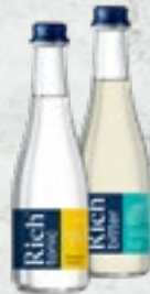
Rich tonic 0,33 л - 229.-