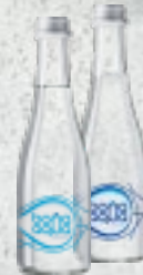
VonaAqua газ/негаз 0,33 л - 229.-